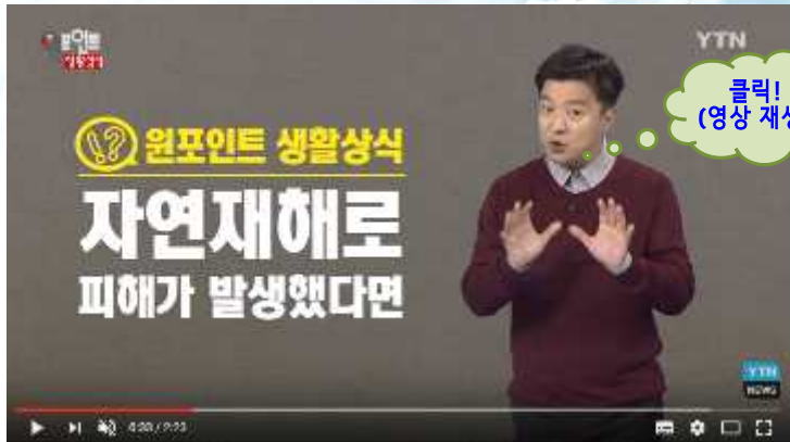
자연재해로 피해가 발생했다면 / YTN (2분23초) https://youtu.be/3QMqMLa5VuY